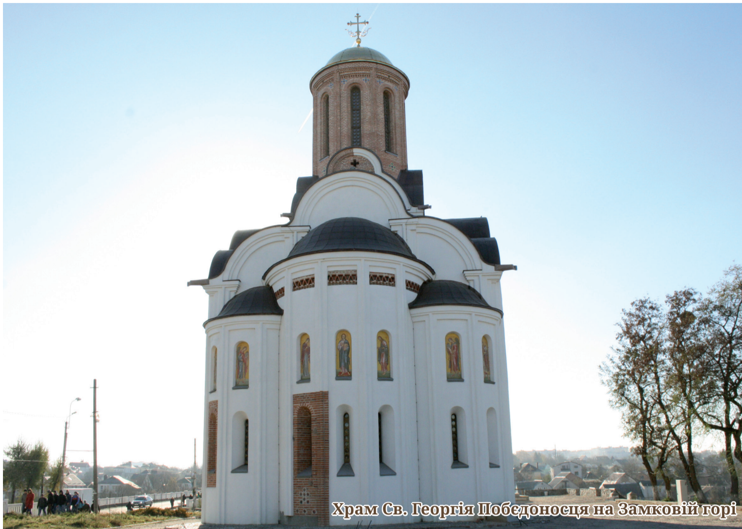
Храм Св. Георгія Победоносця на Замковій горі

ВІСНИК БЛАГОДІЙНОГО ФОНДУ КОСТЯНТИНА ЄФИМЕНКА WWW.EFIMENKO.ORG